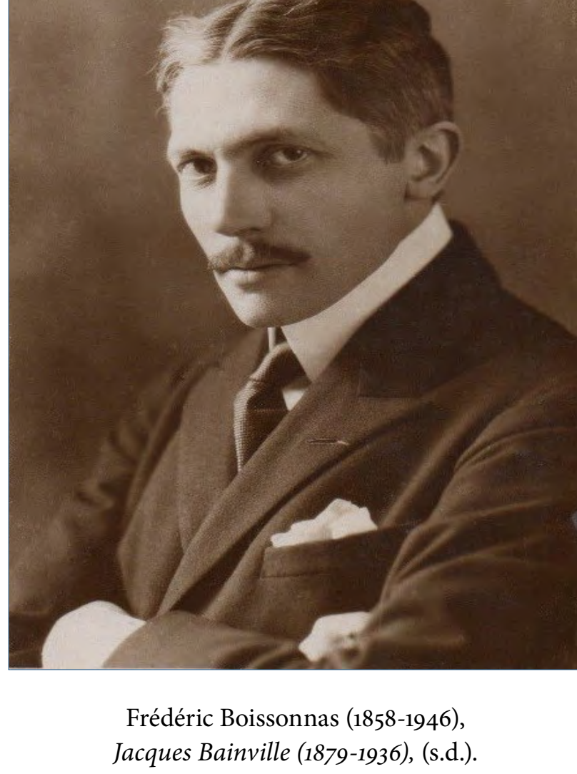
Frédéric Boissonnas (1858-1946), Jacques Bainville (1879-1936), (s.d.).